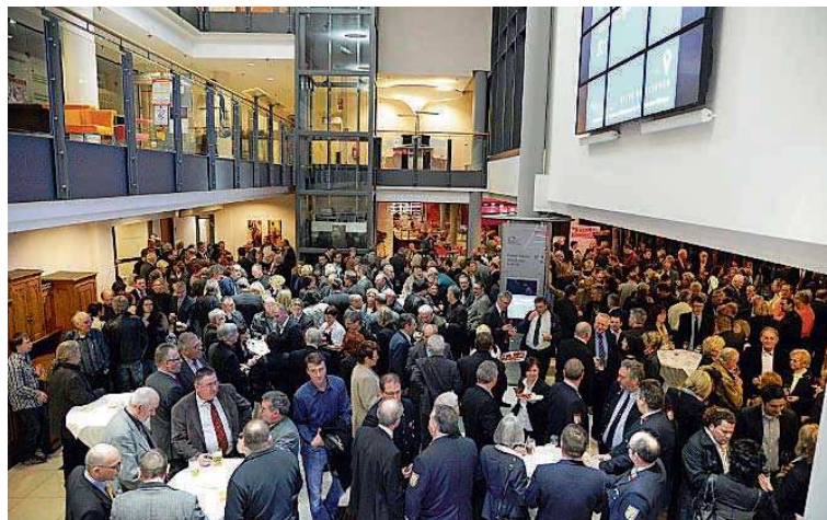
Gebaut für Bildung, Kommunikation, Geselligkeit: das Kongresszentrum der Völklinger SHG-Kliniken (hier beim städtischen Neujahrsempfang 2011).